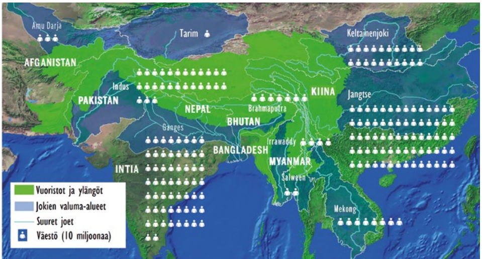
Tiibetin ylängöltä ja ympäröivistä vuoristoista alkunsa saavat suuret joet, niiden valuma-alueet ja valuma-alueiden väestömäärä. Lähde: SHARMA, E. ja muut. "Introduction to the Hindu Kush Himalaya Assessment." Teoksessa: WESTER, P. ja muut (toim.) The Hindu Kush Himalaya Assessment . Springer, Cham. 2019. Ss. 1 – 16.

töjä. 7 Kesäaikainen kuivuus vähentää jokien virtaamaa ja sitä kautta vesivoiman tuotantokykyä. Vesien lämpeneminen vaikuttaa myös lämpövoimaloiden jäähdytysveden saantiin. 4